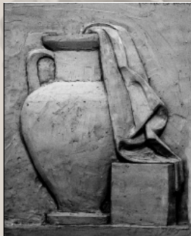
Скульптура - натюрморт

На экзамене абитуриенту предстоит выполнить несколько вариантов эскиза на одну из предложенных тем (историческая, литературная, жанрово-бытовая). продолжительность 5 академических часов в условиях мастерской. Материал – пластилин, размеры 15-20 см, проволоку, отвертку, плоскогубцы, саморезы по дереву 3/20 мм- 20 шт. При оценке работ по композиции конкурсная комиссия учитывает: выявление основных конструктивных и пластических особенностей формы, общее художественное впечатление от работы и пластических особенностей формы, степень завершенности работы.