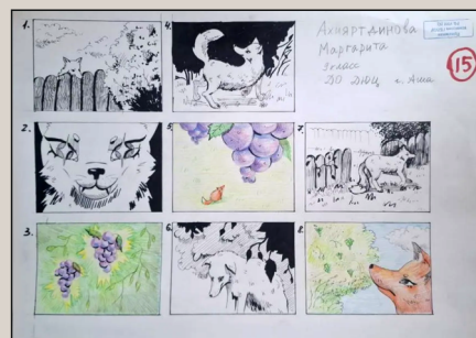
Композиция - Анимация