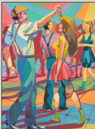
Композиция - живопись