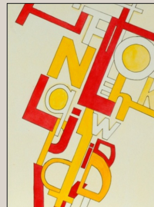
Композиция - дизайн