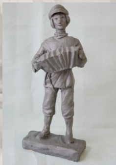
Композиция - скульптура